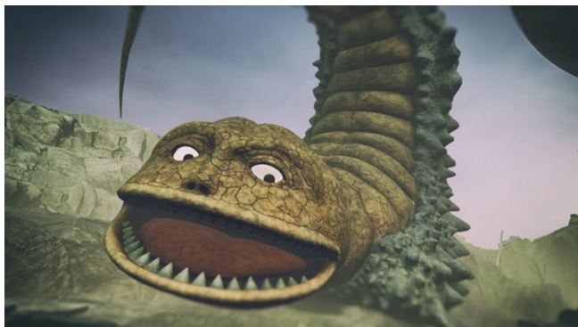
▲本コンテンツに登場する怪獣たち(※一部抜粋)

本コンテンツは、円谷プロダクション原作の「空想科学絵本 かいじゅうのすみか」(※1)をVRコンテンツとして開発するもので、本プロジェクトの制作は、TBS 出資のベンチャー企業ティフォン(※2)が担当。円谷プロダクションからも全面協力を受けています。xR(VR/AR/MR)コンテンツ制作に強みを持つティフォンによって、幅広い世代に人気を集める円谷怪獣たちの様子を、VRの世界でリアルに表現。迫力満点のコンテンツに創り上げました。