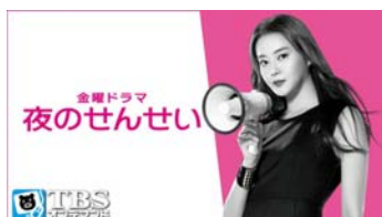
金曜ドラマ「夜のせんせい」