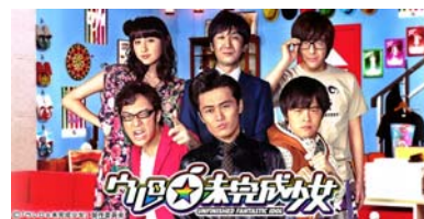
「ウレロ☆未完成少女」