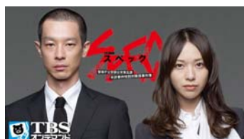
「SPEC〜警視庁公安部公安第五課 未詳事件特別対策係事件簿〜」