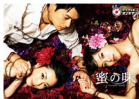
「蜜の味〜A Taste Of Honey〜」