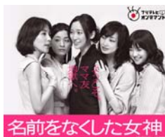
「名前をなくした女神」