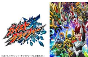
「ガイストクラッシャー」